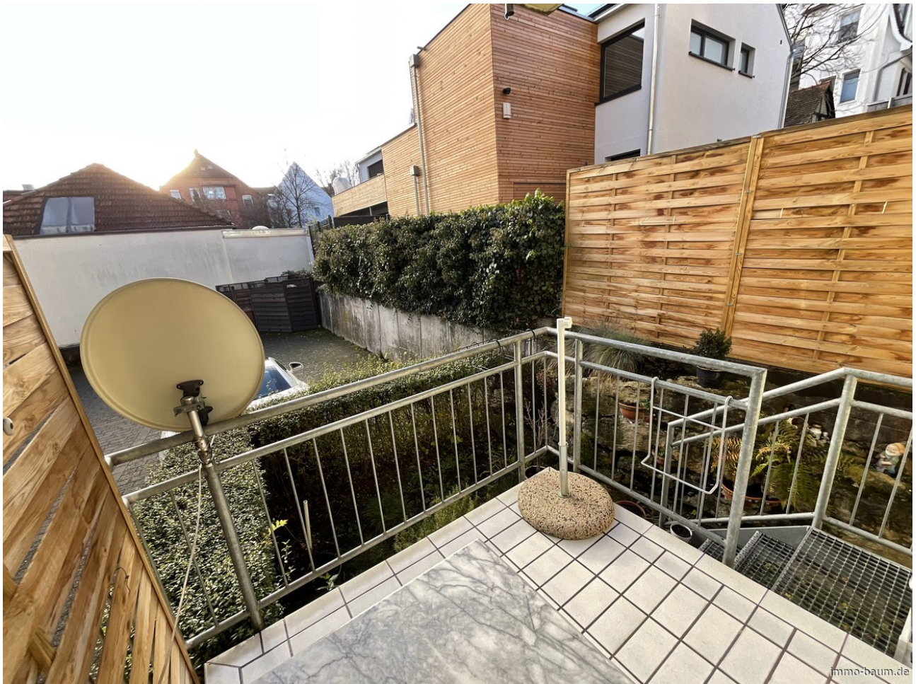
Blick vom Gartenbalkon in den Hinterhof