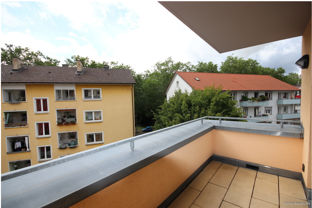
Blick von der Dachterrasse